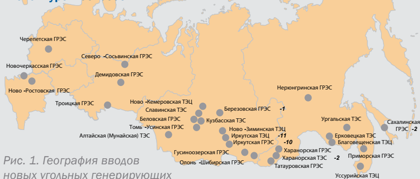
Рис. 1. География вводов новых угольных генерирующих мощностей в 2011-2030 гг.

Новые генерирующие мощности будут основаны на «чистых» угольных технологиях (ССКП, ЦКС, газификации угля и других), так как рост платы за выбросы и возможное введение платы за CO 2 сделает производство электроэнергии на угле по традиционным технологиям еще более неконкурентоспособным.