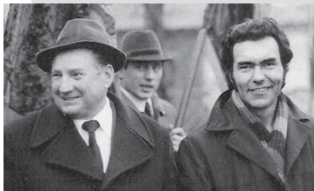
На демонстрации 7 ноября в 80-е гг.