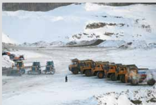
В самом конце декабря в Прокопьевском районе был введен в эксплуатацию разрез ООО УК «Сибкоул» (участок «Верхне-Саландинский»)