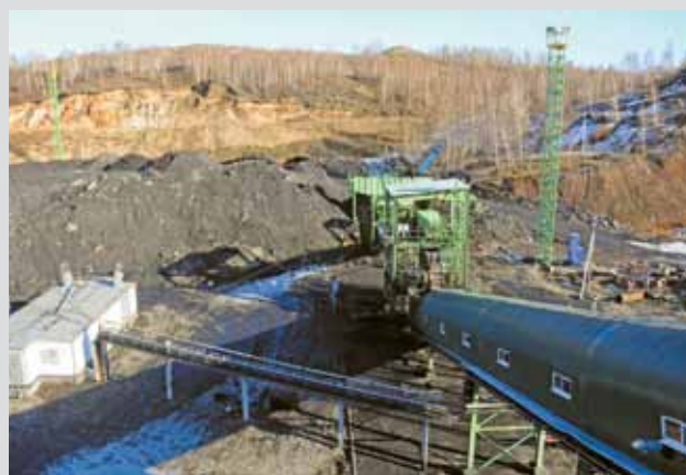
Обогатительная установка с крутонаклонным сепаратором заработала на разрезе «Краснобродский» — на Вахрушевском поле