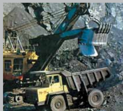
ООО «Энергоуголь» образовано в 2009 году, введено в строй действующих 15 июля 2011 года. Административно участок «Подгорный» входит в состав Новокузнецкого района