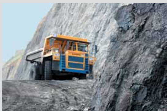
Еще одно новое предприятие года — ОАО «Разрез им. В.И. Черемнова». Входит в группу компаний «Талтэк»