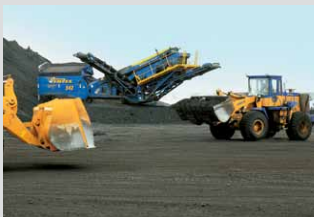
В Беловском районе заработала шахта-разрез «Инской» с объемом инвестиций в 4,4 миллиарда рублей — инвестор ООО «Управляющая компания «Промуглесбыт»