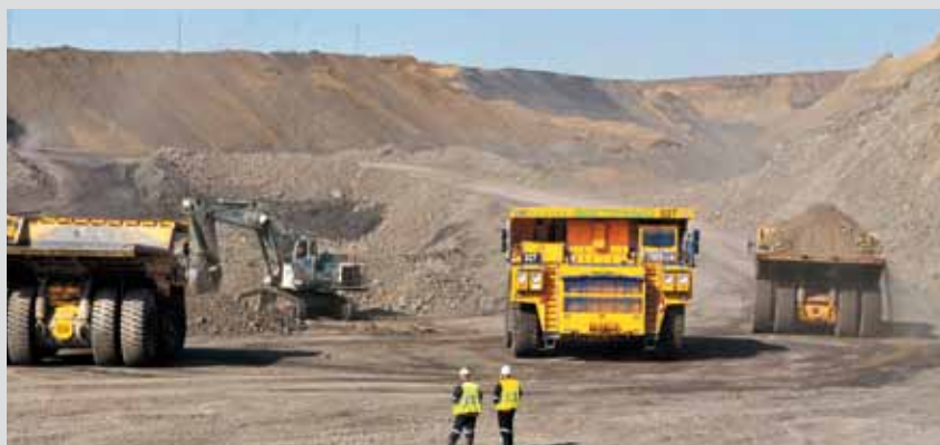
Разрез «Восточный» построен на инвестиции ХК «СДС» и открыт в августе 2010 года. Производственная мощность 3 миллиона тонн угля

За несколько лет до главного торжества области — ее очередного, 70-летнего, юбилея в угольной отрасли региона был совершен настоящий прорыв! Угольные предприятия росли как грибы после дождя. И об этом мало написать. Проще — показать воочию. ...Если кто-то рассуждает про кризис — то это не про нас. Не про Кузбасс.