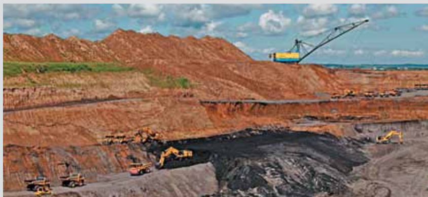
В июле в Беловском районе введен в строй суперсовременный разрез «Караканский-Западный» (является структурным подразделением ЗАО «Шахта «Беловская»)