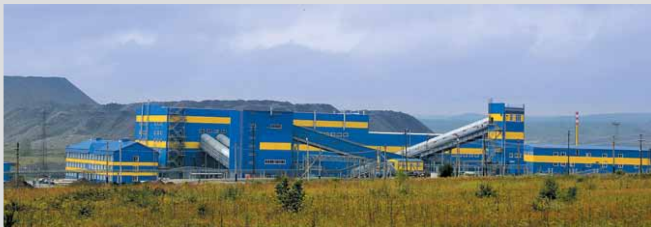
В августе, накануне профессионального праздника Дня шахтера, ОАО «УК «Кузбассразрезуголь» вводит в опытно-промышленную эксплуатацию современную обогатительную фабрику «Краснобродская-Коксовая» стоимостью около 3,3 миллиарда рублей. Это первая обогатительная фабрика на Краснобродском угольном разрезе