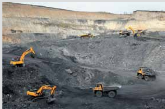
5 февраля 2010 года ООО «МаррТЭК» запустило в эксплуатацию свое первое угольное предприятие на территории Кемеровской области — разрез «Степановский», строительство которого было начато в 2008 году. Это около 200 рабочих мест сразу и свыше 200 — дополнительно в перспективе