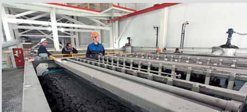
ОФ «Каскад» — первая фабрика, которую «Кузбасская Топливная Компания» вводит в производство в августе 2010 года