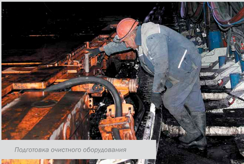
Подготовка очистного оборудования