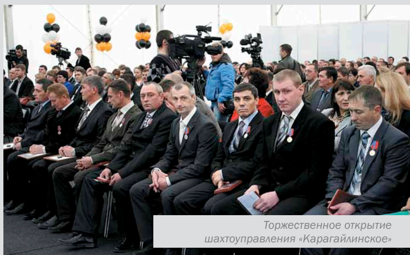
Торжественное открытие шахтоуправления «Карагайлинское»