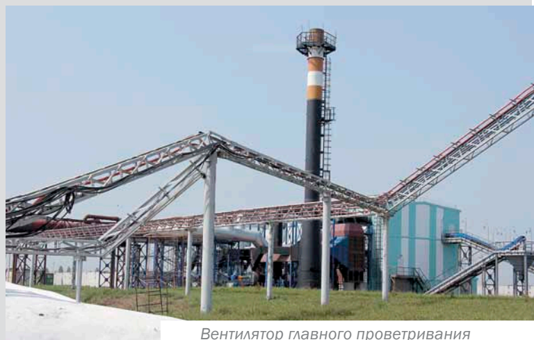
Вентилятор главного проветривания на площадке Южных стволов

Начиная с 2008 года, после оформления проектно-разрешающей документации, на предприятии начато строительство четырех наклонных стволов, объектов поверхностной инфраструктуры, на списанных ранее участках пластов велись вскрышные работы для добычи угля открытым способом. Кризис 2009 года приостановил работы. Весной 2011 года строительство шахты и обогатительной фабрики компанией было возобновлено.